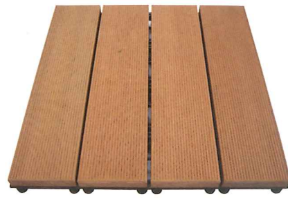
東南アジアの セランガンバツ